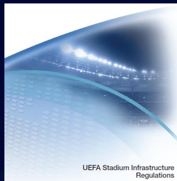
UEFA Stadium Infrastructure Regulations